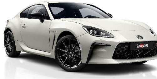
K1X Crystal Pearlwhite Metallic