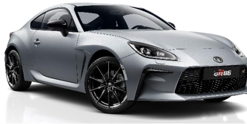
G1U Ice Silver Metallic