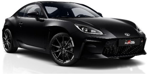
D4S Furious Black Metallic