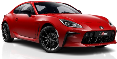
DCK Ignition Red Metallic