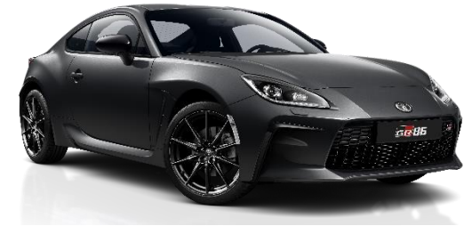
P8Y Magnetite Grey Metallic