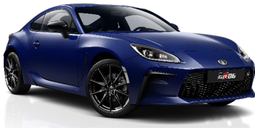
WCH Sapphire Blue Metallic

Erfahrungsgemäß können Druckfarben den Farbton von Lackierungen nicht originalgetreu wiedergeben.