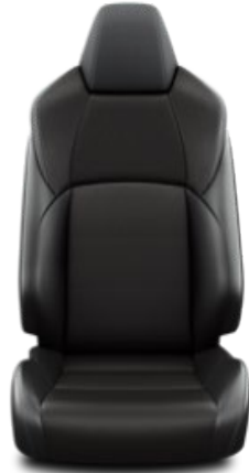
Teilleder schwarz (EA21)