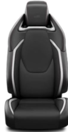
Teilleder schwarz/grau (FC21)