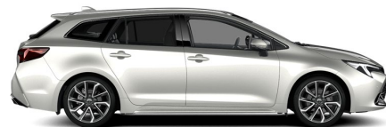
1J6 Precious Silver Metallic