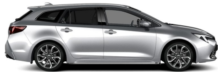
1L0 Shimmering Silver Metallic