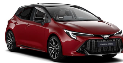
2SZ Emotional Red / Night Sky Black