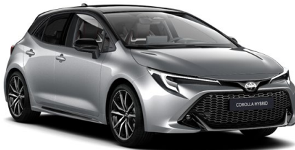
2TX Shimmering Silver / N. S. Black