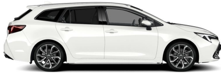
040 Pure White