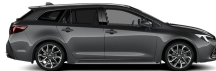
1G3 Ash Grey Metallic