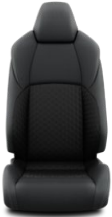
Stoff schwarz (FB21)