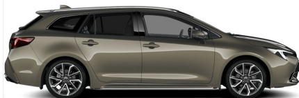
6X1 Oxide Bronze Metallic