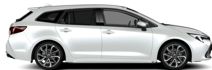
089 Platinum Pearlwhite Metallic