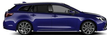
8Y8 Juniper Blue Metallic