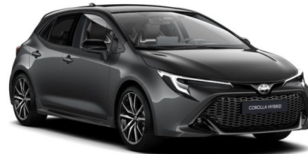
2MB Ash Grey / Night Sky Black