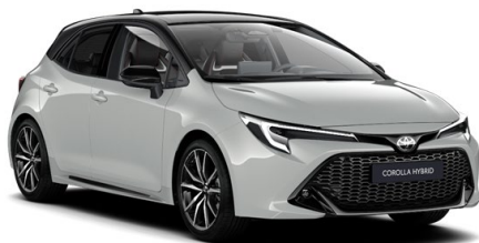
2RZ Dynamic Grey / Night Sky Black