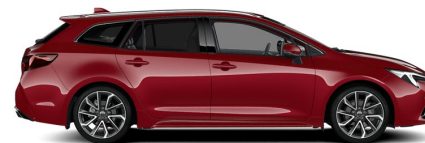
3U5 Emotional Red Metallic