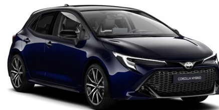
2UQ Midnight Blue / Night Sky Black