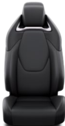
Leder schwarz (LC20)