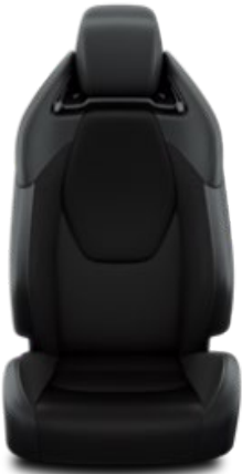
Teilleder schwarz (LA21)