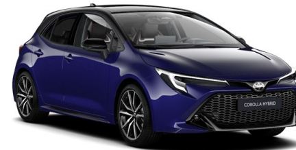
2VL Juniper Blue / Night Sky Black