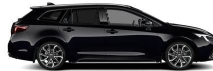
209 Night Sky Black Metallic