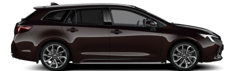
4W9 Phantom Brown Metallic