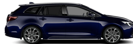
8X8 Midnight Blue Metallic