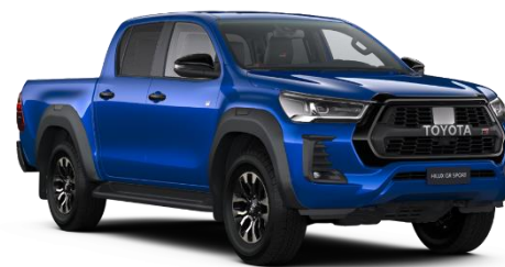
8X2 Nebula Blue Metallic