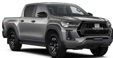
1D6 Zircon Silver Metallic