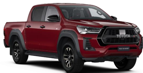
3T6 Crimson Spark Red Metallic