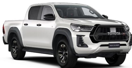
089 Platinum Pearlwhite Metallic

Erfahrungsgemäß können Druckfarben den Farbton von Lackierungen nicht originalgetreu wiedergeben