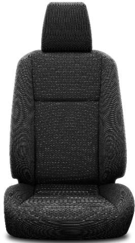
Sitzbezug Stoff schwarz