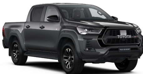
1G3 Ash Grey Metallic