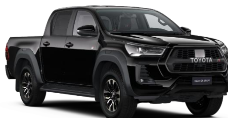
218 Attitude Black Metallic