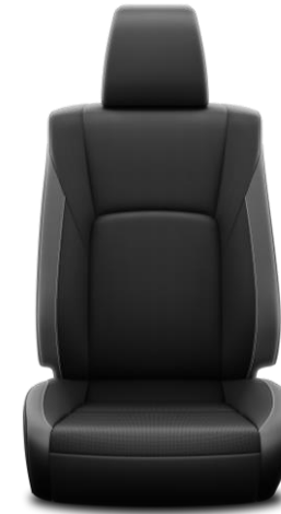
Sitzbezug Leder perforiert 1) Schwarz/grau