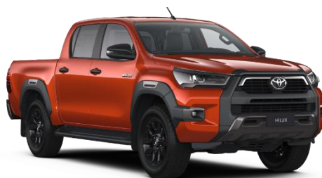
4R8 Inferno Orange Metallic