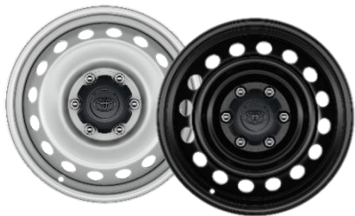
17" Stahlfelge mit Nabenkappe silber (Single Cab) schwarz (X-tra & Double Cab)