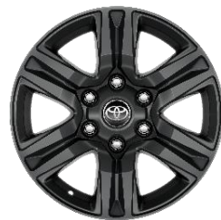
17" Leichtmetallfelge 5 Speichen schwarz