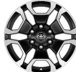
18" Leichtmetallfelge 6 Speichen, Y-Design schwarz/oberflächenpoliert