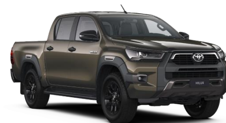
6X1 Oxide Bronze Metallic