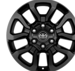
18" Leichtmetallfelge 5 Doppelspeichen schwarz