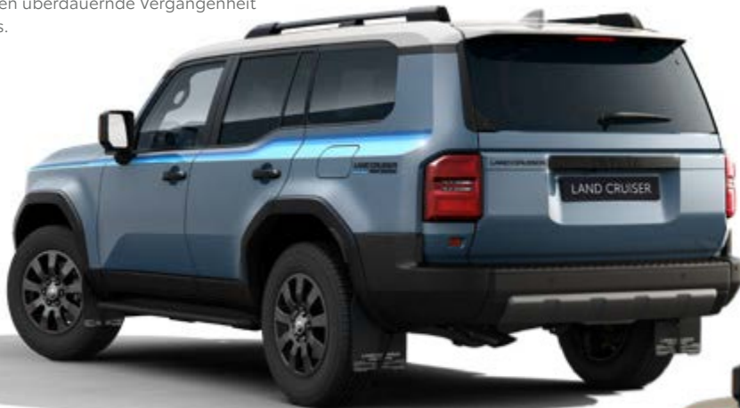
Farbpalette Dark Bondi Blau

Die Toyota Land Cruiser First Edition Zubehör, wie Textilfußmatten, Dekoraufkleber im Retrodesign und Schmutzfänger stehen in der Tradition des Land Cruiser Originals und sind eine Hommage an die legendäre und Generationen überdauernde Vergangenheit des Modells.